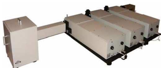
Рис. 1. Общий вид тройного КР спектрометра.

Наилучший результат получается при использовании тройного спектрометра, состоящего из двойного входного монохроматора, который используется для подавления линии возбуждения, и выходного каскада - спектрографа с высоким разрешением, который служит для получения спектров комбинационного рассеяния. В МЛЦ МГУ создан экспериментальный макет тройного КР спектрометра (рис. 1), в основе которого лежит оригинальная идея соединения трех моторизованных спектрографов, в которых